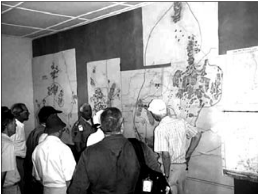
Bild 13 HQ Camp Tillö op-rum