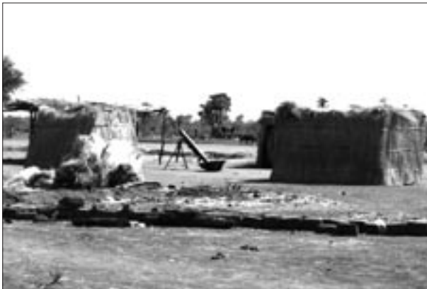
Granatkastare inne i en av byarna

Flyktingar i stora mängder började återvända till området. World Food Program (WFP) beräknade att så