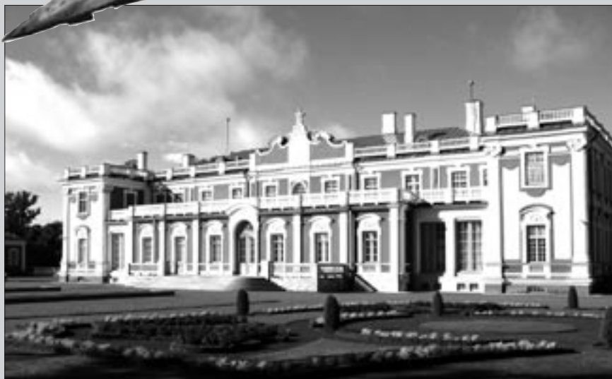
Slottet i Tallinn