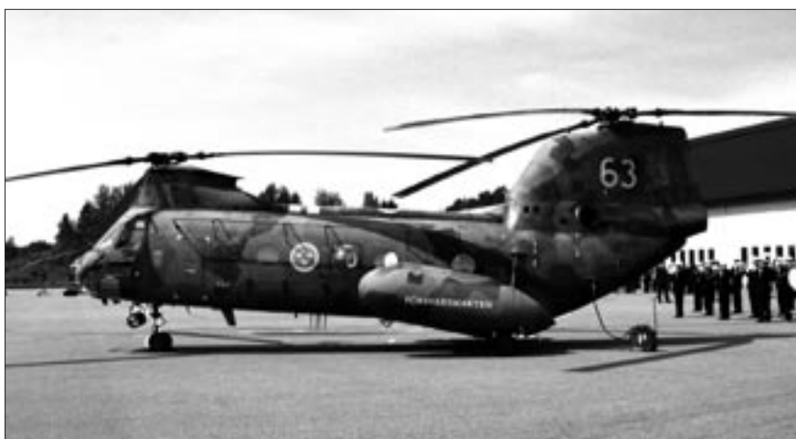
Hkp 4 avvaktar för start efter ceremonin

Stockholm har nu mist tillgången till denna mycket kvalificerade räddningstjänst.