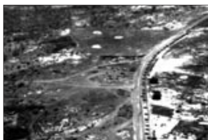
Boplatser på väg till HQ

F18-Kamraten var där och dokumenterade ceremonin