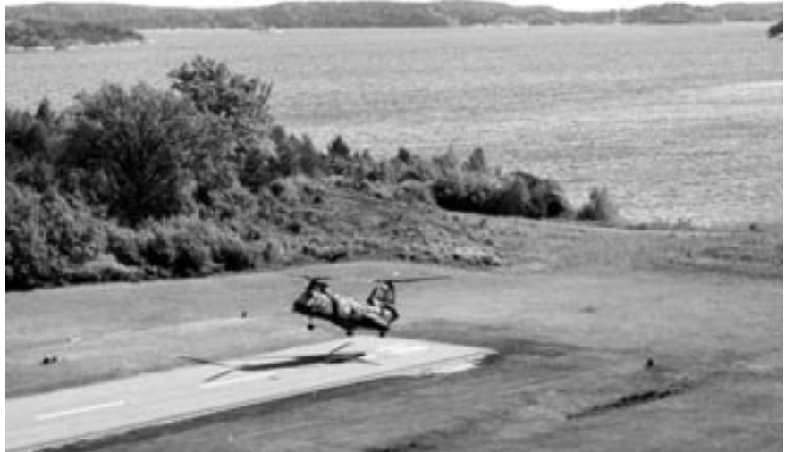
Sista landningen på 1. Hkp-div/2Hkpskvadronen

Hkp 6B licenstillverkades i Italien. (Hkp 6, Jet Ranger Augusta Bell 206)