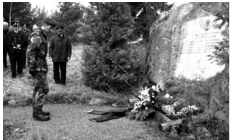
Minnesgudstjänst och kransnedläggning den 7 november 2005