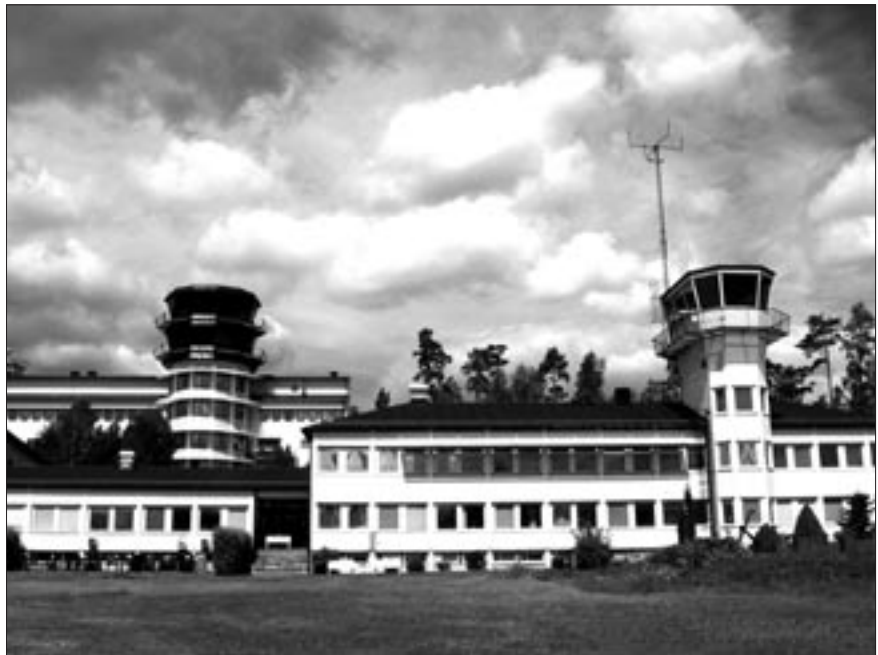
Nya tornet för flygledare och meteorologer i bakgrunden