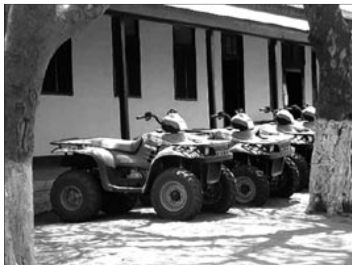
ATV för patrullerna

Kontakt nätverken som personalen från GoS och SPLM/A besatt innebär att teamen höll sig välinformerade om hela ansvarsområdet även om vissa avlägsna delar av område inte besöktes så frekvent. I samband med regnperioden är det inte enkelt att ta sig ut i området på grund av dåliga eller obefintliga vägar. Då används ATV (All Terrain Vehicle, se bild nedan) av teamen. De har ett mycket lågt marktryck och tar sig fram nästan överallt. Risken för olyckor med fordonen är stor och är också en stor olycksorsak i missionen.