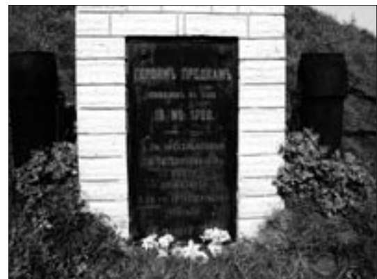
Minnesmärke över slaget vid Narva

Narva är Estlands tredje stad med 67 000 innevånare av vilka 98 % är rysktalande. Detta nordöstra hörn av Estland är den del av landet som är mest eftersatt och bär störst spår