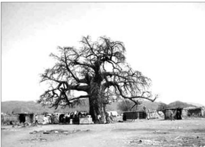
Bybor samlade vid ett Djävulsträd.