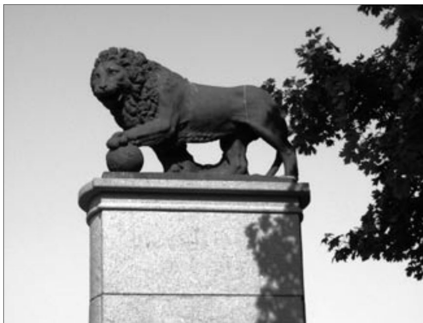
Det svenska lejonet vid Narva

Ett minnesmärke finns rest vid flodstranden där slaget stod och inne i Narva, i närheten av gränsövergången, finns ett monument med det svenska lejonet som påminnelse om banden till Sverige.