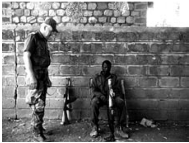
Ordföranden i samtal med gerillasoldat från Eritrea. Det Svenska deltagandet i UNMEE (United Nation Mission in Ethiopia/Eritrea).

A terigen har ett år passerat. Ett år med många stora tragiska händelser som berört många människor runt om i världen; tsunamin, sprängning Londons tunnelbana, jordbävningar och pariskravaller. Givetvis tänker vi på alla dem som drabbats och deras anhöriga. Men vi kan även summera händelser som gör oss glada och positiva. Alla rapporter pekar dock på att allt som händer och drabbar oss slår nya rekord (bra och dåliga) år från år. Vi får hoppas att kommande år kommer att innehålla mer positiva än negativa händelser.