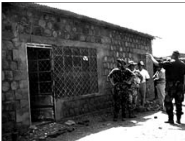
Blivande patrullbas HQ

Det kom att dröja innan antalet monitorer var så många att flera patrullbaser kunde bemannas. Under april-maj 2002 blev första uppgiften för JMC/JMM-gruppen att åka runt i missionsområdet och informera om eldupphöravtalet (CFA).