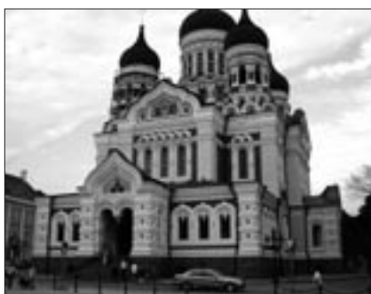
Ryskortodoxa kyrkan i Tallinn