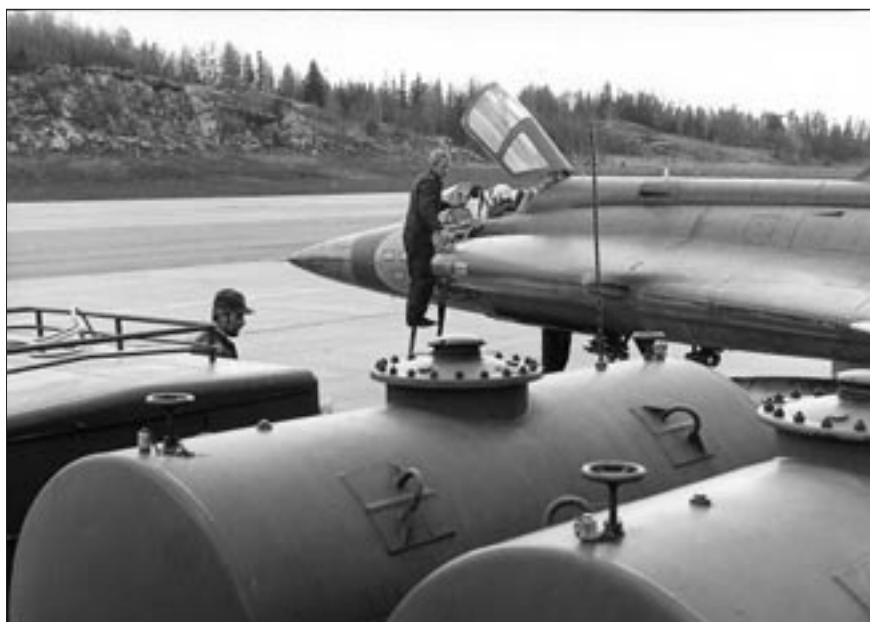
Flygplanet har klargjorts och överlämnas till piloten

VB = Vakthavande befäl KC = Kommandocentral am = ammunition akanam = ammunition för automatkanon